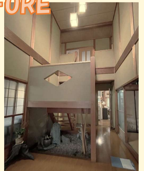
坪庭がお洒落な玄関ホールでした