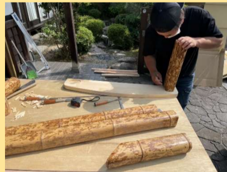
手すりに利用されていた竹を今度は飾り棚に使います