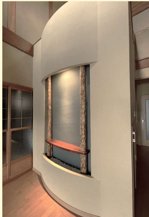
足元には白い玉砂利を、上部には埋込のスポットライトを設けました。