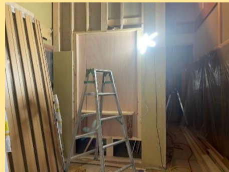
玄関の飾り棚を作っています