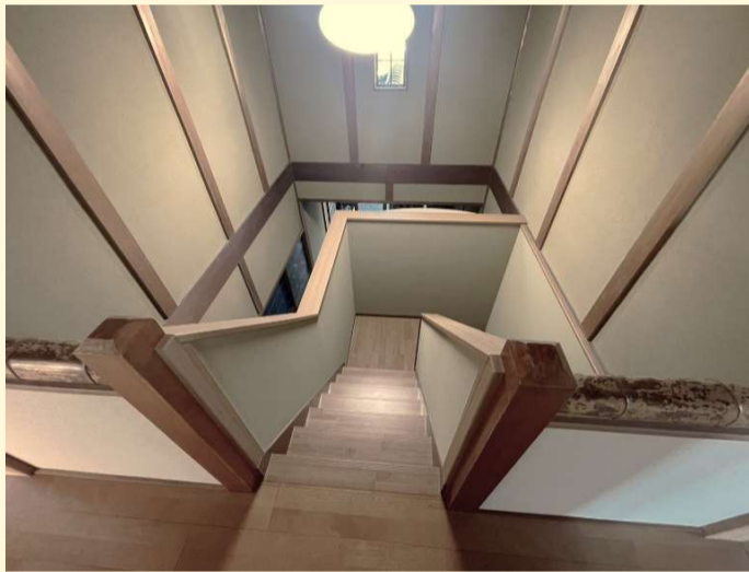
緩くて安全な階段に生まれ変わりました